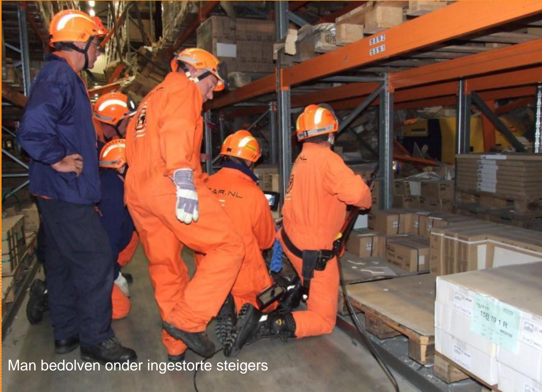
Man bedolven onder ingestorte steigers